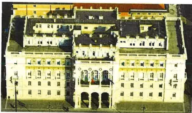
Prefettura di Trieste. Copertura terrazze ed impermeabilizzazioni del piano terreno del palazzo palificato sul mare di Piazza Unità d'Italia.