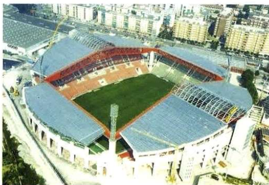
Stadio Nereo Rocco. Coperture ed impermeabilizzazioni del nuovo Stadio di Trieste.

Questi interventi sotto vincolo rappresentano oggi quasi metà del fatturato dell'azienda. Ciò comporta una sinergia completa tra i lavori della OS8 e quelli della OG2. Oltre a ciò i parametri comportamentali vengono qualificati con certificazione ISO 9001. Iniziative Edili Bizeta sta nella "white List" del Commissariato del Governo.