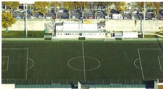
Impermeabilizzazione e creazione di un campo di calcio in erba sintetica a copertura di un parcheggio di 700 posti auto.