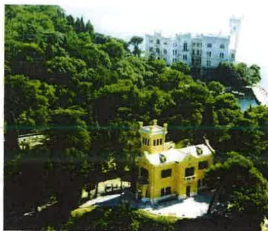
Castello e Castelletto di Miramare. Copertura in zinco titanio del Castello di Miramare e dell'attiguo Castelletto